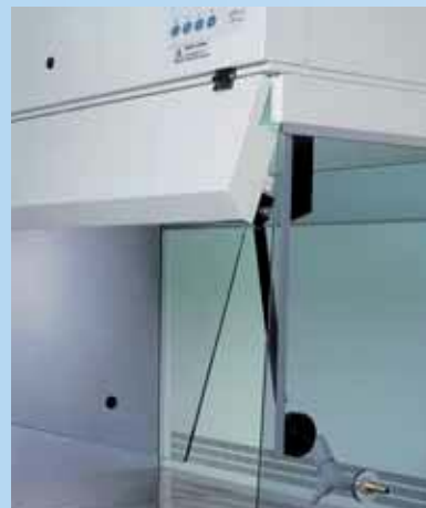
Cristallo temperato frontale controbilanciato con ammortizzatori a gas per mantenerlo aperto facilita l'introduzione di grossi oggetti e una facile pulizia