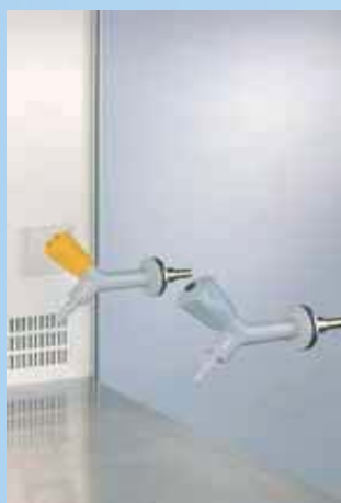
Rubinetti per gas e vuoto opzionali