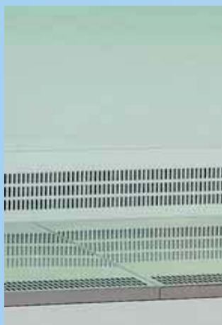
Piano di lavoro diviso in vassoi di acciaio inox di facile pulizia