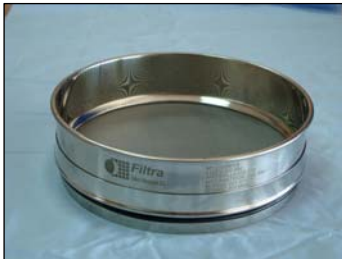
Setacci inox con rete metallica in acciaio.

Setacci Filtra per test di laboratorio, con maglia metallica o con piastra perforata (quadrata, rotonda o ovale), secondo le norme nazionali ed internazionali standard: UNE, ISO, ASTM, AFNOR, BS, etc.