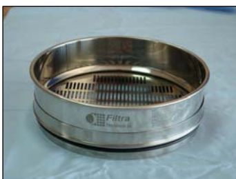
Setacci con piastra in acciaio inox forata (ovale)

⇒ I setacci Filtra possono essere montati uno con l'altro oppure anche con setacci di altri produttori.