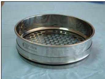
Setacci con piastra in acciaio inox forata (rotondo)