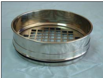
Setacci con piastra in acciaio inox forata (quadrato)