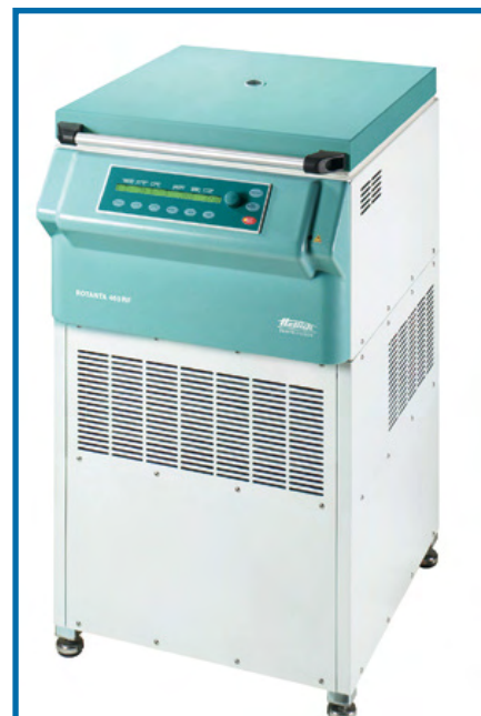
ROTANTA 460 RF CENTRIFUGA DA PAVIMENTO, DI RAFFREDDAMENTO