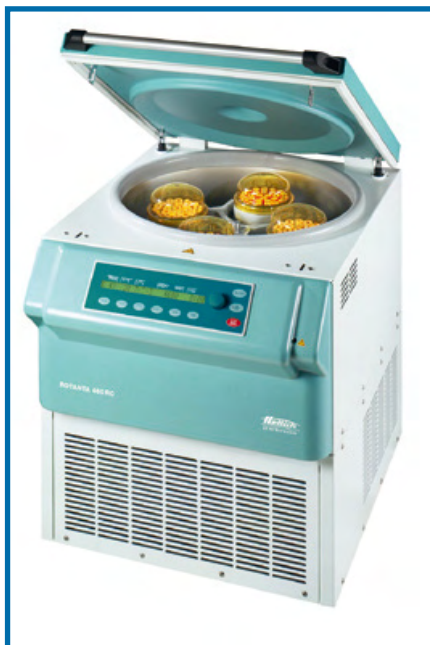
ROTANTA 460 RC CENTRIFUGA DA SOTTOBANCO, DI RAFFREDDAMENTO