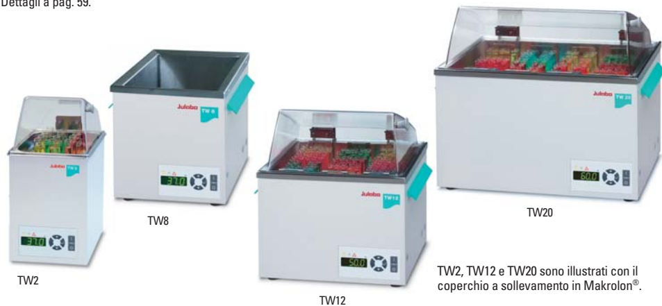
TW2, TW12 e TW20 sono illustrati con il coperchio a sollevamento in Makrolon®.