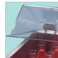
Coperchio sollevabile Makrolon®