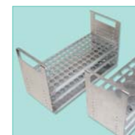
Portaprovette in acciaio inossidabile