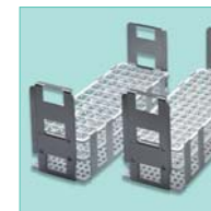
Portaprovette in Polipropilene®